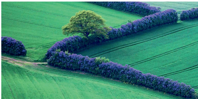
Fynsk syrenhegn. Ill. fra bogen. Lilac hedgerow, Funen. Ill. from the book.

Nogle af værkerne befinder sig i feltet mellem landskabsarkitektur og kunst, og det