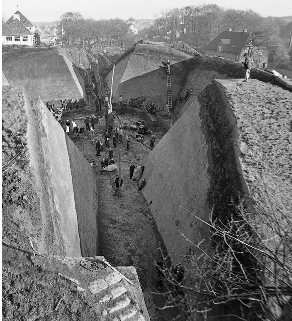
I 1941 blev iværksat en udgravning af Sydhøjen under ledelse af arkitekten og arkæologen Einar Dyggve. Hvor radikalt et indgreb i højen det var, fremgår af fotografiet, som findes i museet Kongernes Jelling In 1941 an excavation of the South mound was launched under the direction of architect and archaeologist Einar Dyggve. The radicalness of the intervention in the hill is seen in the photography from the museum The Royal Jelling

Bogen må anbefales, både som grundig afrapportering af en stor og enestående sag og som mulighed for at blive beriget af såvel historie som nutid. AL