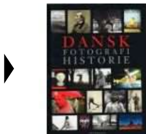
DANSK FOTOGRAFI HISTORIE

(/article/items/view/2892/4) ( http://www.historie-online.dk/boger/anmeldelser-5-5/kunst-arkitektur-haver-design-mode/dansk-fotografi-historie )