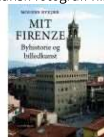
MIT FIRENZE. BYHISTORIE OG BILLEDKUNST

(/article/items/view/2892/4) ( http://www.historie-online.dk/boger/anmeldelser-5-5/kunst-arkitektur-haver-design-mode/dansk-fotografi-historie )