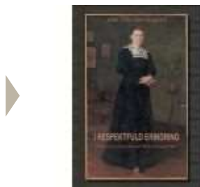
I RESPEKTFULD ERINDRING