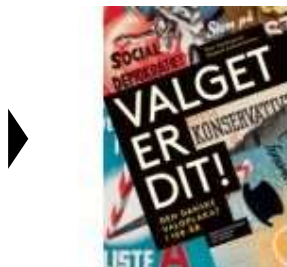
VALGET ER DIT!

( http://www.historie-online.dk/boger/anmeldelser-5-5/kunst-arkitektur-haver-design-mode/valget-er-dit ) ( http://www.historie-online.dk/boger/anmeldelser-5-5/kunst-arkitektur-haver-design-mode/moentmestergarden )