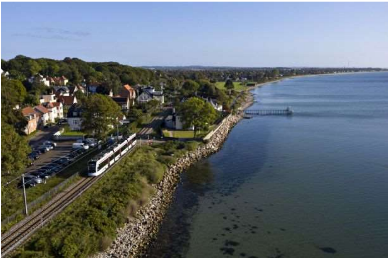
Riisskov med letbanen langs Kattegatkysten.

Men der er jo også en del af kommunen, der ligger uden for byen. I det åbne landskab er der både søer, moser og vandløb. Og der er faktisk også landbrugs land, der fylder hele 53 % af kommunens areal. Der er 70 km kystlinje med Riisskov og Marselisborgskovene som grønne punkter langs vandet. Skove og landskaber, kyster og vande beskrives naturligtvis meget flot i dette bind, som jo ellers er meget præget af den store by. Og der er jo da også blevet plads til stationsbyerne Lystrup, Beder-Malling, Lygten og Mårslet, som er blevet udviklet kraftigt gennem de senere år med store bebyggelsesområder, hvis indbyggere næsten alle pendler til Aarhus for at arbejde og studere. Den efterhånden notorisk berømte "Leth-bane" har gjort det nemmere for pendlerne at flytte sig, når der ikke er nedbrud på sporene.