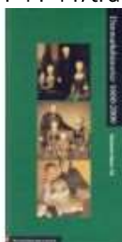
▶ DANMARKSHISTORIER 1660 - 2000

( http://www.historie-online.dk/boger/anmeldelser-5-5/historie-og-topografi-11-11-11/trap-danmark-bind-29 ) ( http://www.historie-online.dk/boger/anmeldelser-5-5/historie-og-topografi-11-11-11/danmarkshistorier-1660-2000 )