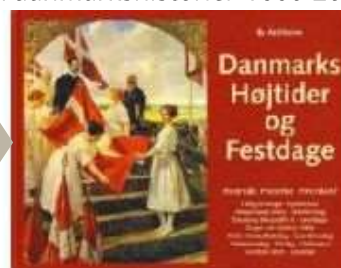
▶ DANMARKS HØJTIDER OG FESTDAGE

( http://www.historie-online.dk/boger/danmarks-hoejtider-og-festdage )