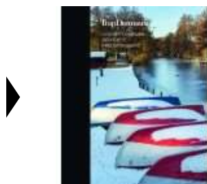
▶ TRAP DANMARK BIND 29

( http://www.historie-online.dk/boger/anmeldelser-5-5/historie-og-topografi-11-11-11/trap-danmark-bind-29 ) ( http://www.historie-online.dk/boger/anmeldelser-5-5/historie-og-topografi-11-11-11/danmarkshistorier-1660-2000 )