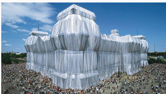
Den indpakkede rigsdagsbygning i Berlin.

Til dem af jer, der ligesom undertegnede umiddelbart, fik nogle lidt lunkne associationer til mit eget fags værste ’smørstegte’ floskler, for at bruge endnu et af Thaus herlige tillægsord, da jeg blev præsenteret for bogens titel ”Om transparens og andre essays”, kan jeg forsikre, at bogens crescendo handler om langt mere end det til tider ansvarsforflygtigende og postulerende begreb transparens.