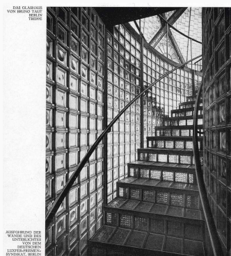
Glastrappen i Bruno Tauts pavillion.

”Trapper i 1800-tallets offentlige bygninger er ofte så bredde, at man ikke kan kontrollere både deres højre og venstre side. Gelændere forekommer at være så svære, at man ikke kan fatte om dem, de virker som suverænt faldende, kontinuerne blokke i poleret marmor. Opstigningen kan derved indstifte et mindre limbo, hvor man selv i oprejst position bøjer nakken”.