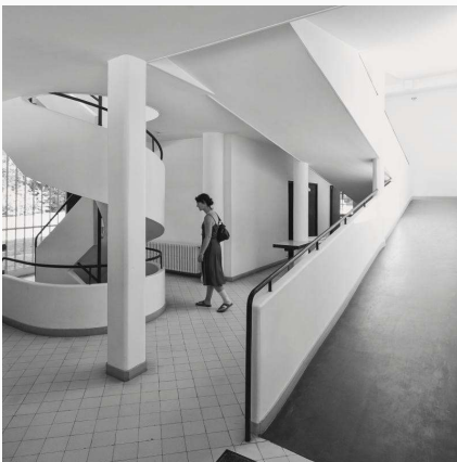
Entreen i Le Corbusiers Villa Savoye.

Utvivlsomt endnu en videnskabelig sten, der bør vendes, men som arkitekt bliver jeg primært optaget af at forstå, hvorfor mesteren selv ifølge Thau udtrykkeligt tog afstand fra netop den analytiske kubisme?