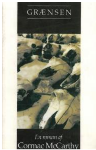
(/boeger/over-graensen-1) OVER GRÆNSEN (/BOEGER/OVER-GRAENSEN-1) Af Cormac McCarthy