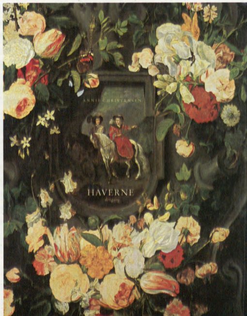
Bogens forside. Kong Frederik III og Dronning Amalie til hest, omgivet af blomster og løvværk. Maleri af O. Elliger, ca. 1655. De danske Kongers kronologiske Samling, Rosenborg • Book cover. King Frederik III and Queen Amalie on horseback surrounded by flowers and foliage. Painting by O. Elliger, ca. 1655. De danske Kongers kronologiske Samling, Rosenborg.