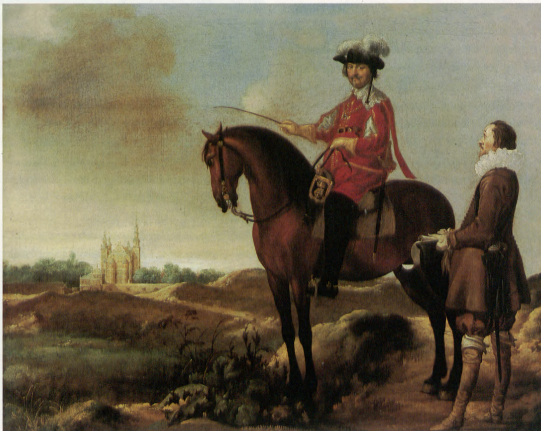
Tidligste gengivelse af Rosenborg Slot. Maleri formentlig af Carel van Mandern, ca. 1638. De danske Kongers kronologiske Samling, Rosenborg. Ill. fra bogen. • Earliest depiction of Rosenborg Palace. Painting presumably by Carel van Mandern, ca. 1638. De danske Kongers kronologiske Samling, Rosenborg. Illustration from book.