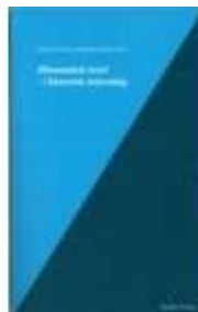
ØKONOMISK TEORI - I HISTORISK BELYSNING