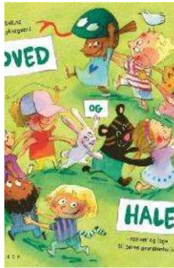
(/boeger/hoved-og-hale-remser-og-leg-til-boerns-grundmotorik) HOVED OG HALE : REMSER OG LEGE TIL BØRNS GRUNDMOTORIK (/BOEGER/HOVED-OG-HALE-REMSER-OG-LEGE-TIL-BOERNES-GRUNDMOTORIK) Af Lotte Salling