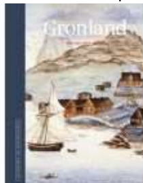
▶ GRØNLAND. DEN ARKTISKE KOLONI

( https://www.historie-online.dk/boger/anmeldelser-5-5/historie-og-topografi-11-11-11/trap-danmark-bind-30 )