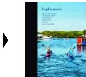
▶ TRAP DANMARK BIND 30

( https://www.historie-online.dk/boger/anmeldelser-5-5/historie-og-topografi-11-11-11/trap-danmark-bind-30 )