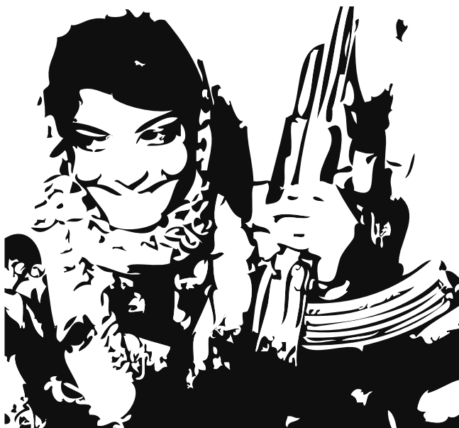
Leila Khaled. Se også andre 'Berømte terrorkvinder' på næste side.

nogle af disse kvinder har mistet en ægtemand, en søn eller andre pårørende. Men ved at klumpe dem sammen i den samme kategori som sørgende »sorte enker«, overser man, at måske mange af disse kvinder slet ikke er motiveret af personlige, men af politiske årsager.