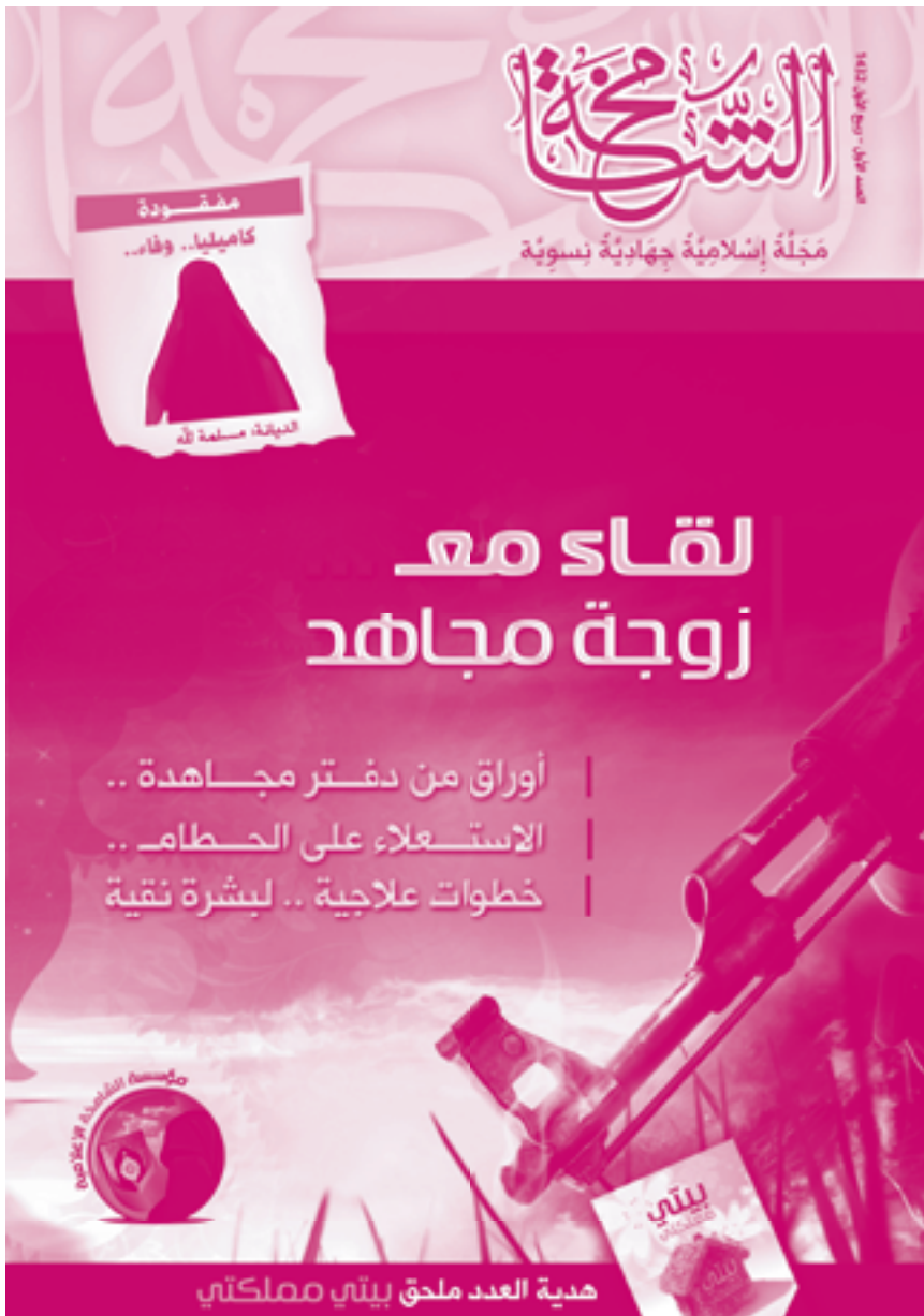
Forsiden af det arabiske magasin for kvinder.

Allerede i 2004 udkom det elektroniske magasin al-Khansaa . Dette magasin var målrettet kvinder med et lyserødt layout og smukke illustrationer, og det indeholdt artikler om at opdrage børn til at deltage i kamp og om at yde førstehjælp til sårede, men også om fysisk træning for kvinder, som forbereder