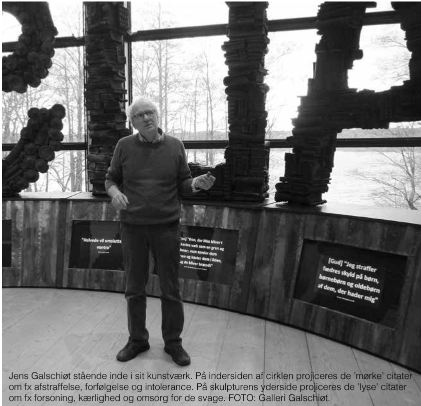
Jens Galschiøt stående inde i sit kunstværk. På indersiden af cirklen projiceres de 'mørke' citater om fx afstraffelse, forfølgelse og intolerance. På skulpturens yderside projiceres de 'lyse' citater om fx forsoning, kærlighed og omsorg for de svage.