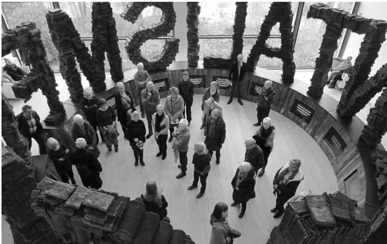
Der er kun én indgang ind i cirklen over hvilken, der står 'Velkommen'. Man kan kun komme ud af den samme åbning, nu under et skilt med teksten 'NO EXIT'.

Begrænset antal pladser. Tilmelding nødvendig: 8681 6329.