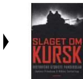
SLAGET OM KURSK

( https://www.historie-online.dk/boger/anmeldelser-5-5/2-verdenskrig-61-61/slaget-om-kursk )