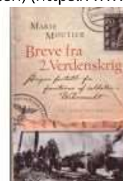
BREVE FRA 2. VERDENSKRIG

( https://www.historie-online.dk/boger/anmeldelser-5-5/2-verdenskrig-61-61/fanget-paa-oestfronten )