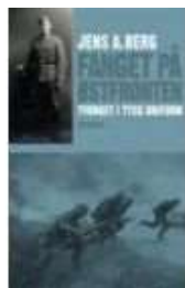
FANGET PÅ ØSTFRONTEN

( https://www.historie-online.dk/boger/anmeldelser-5-5/2-verdenskrig-61-61/slaget-om-kursk )