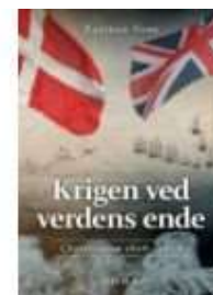
KRIGEN VED VERDENS ENDE

( http://www.historie-online.dk/boger/anmeldelser-5-5/krig-og-terror-militaervaesen-vaben-den-kolde-krig/krigen-ved-verdens-ende )