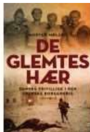
DE GLEMTE HÆR

( http://www.historie-online.dk/boger/ubaaden-der-ramte-sverige ) (/article/items/view/2909/4)