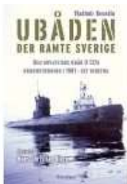
UBÅDEN DER RAMTE SVERIGE

( http://www.historie-online.dk/boger/ubaaden-der-ramte-sverige ) (/article/items/view/2909/4)