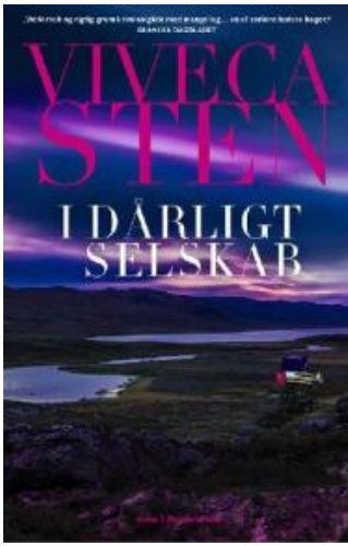
(/boeger/i-darligt-selskab) I DÅRLIGT SELSKAB (/BOEGER/I-DARLIGT-SELKAB) Af Viveca Sten