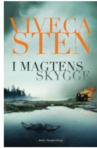
(/boeger/i-magtens-skygge) I MAGTENS SKYGGE (/BOEGER/I-MAGTENS-SKYGGE) Af Viveca Sten