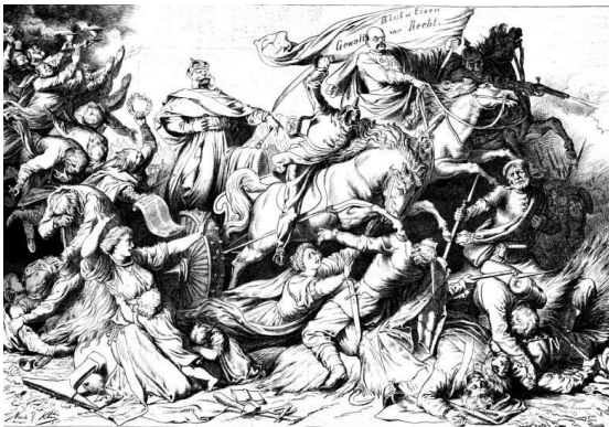
DIE WILDE JAGD 1870. Magten ligger hos staten. Læg mærke til de mange underdanige i øverste, venstre hjørne. Og fortvivlelsen hos den siddende mand. Stik fra o. 1870. HfN.

I 1862 udnævnes han til preussisk ministerpræsident – vejen ad hvilken var der nu. Det er samme år, han holder den berygtede tale om "Blod og jern – Blut und Eisen", hvor der absolut ikke var plads for den mindste frihedstanke.