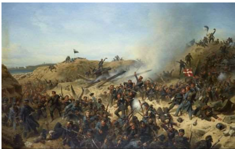
Stormen på skansen den 18. april 1864. Preussisk maleri. HfN