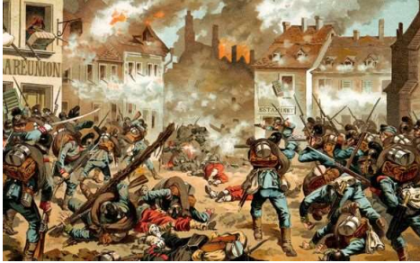
Bykampe under den tysk-franske krig 1870 HfN