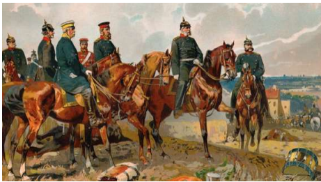
Bismarck med kasket sammen med den preussiske konge, Wilhelm I. Tysk maleri. HfN