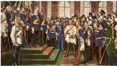
Kroningen af den tyske kejser på slottet Versailles den 18. januar 1871. Bismarck ses i den hvide uniform med det rød/hvide bånd hen over brystet.

Som nævnt tidligere mener nogle tyske historikere i dag, at det giver mening at have endnu en person med: Adolf Hitler. Jeg holder mig nu til den oprindelige formulering. For det var det, der var drivkraften hos Bismarck: at få gjort et samlet Tyskland til den stærke magt på det europæiske kontinent.