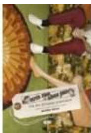
PETER SPAR OG SØREN SOLD - OM DEN FORSIGTIGE

( http://www.historie-online.dk/boger/anmeldelser-5-5/biografier-erindringer-60-60/peter-spar-og-soeren-sold-om-den-forsigtige-generation )