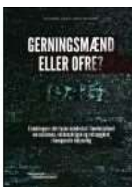
GERNINGSMÆND ELLER OFRE