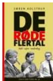
DE RØDE FLERTAL

( http://www.historie-online.dk/boger/anmeldelser-5-5/2-verdenskrig-61-61/gerningsmaend-eller-ofre ) ( http://www.historie-online.dk/boger/anmeldelser-5-5/danmark-og-europa-efter-1945/de-roede-flertal )