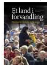
ET LAND I FORVANDLING