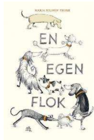
(/boeger/Enegenflok) EN EGEN FLOK (/BOEGER/ENEGENFLOK) Af Maria Nilsson Thore