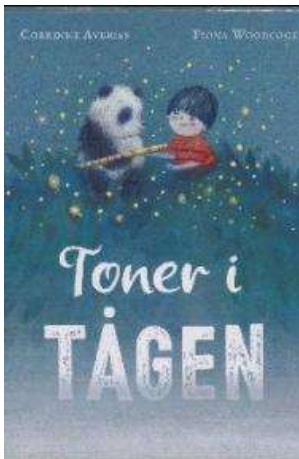
(/boeger/toner-i-taagen) TONER I TÅGEN (/BOEGER/TONER-I-TAAGEN) Af Corrinne Averiss