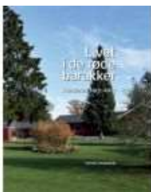
LIVET I DE RØDE BARAKKER

( http://www.historie-online.dk/boger/livet-i-de-roede-barakker )