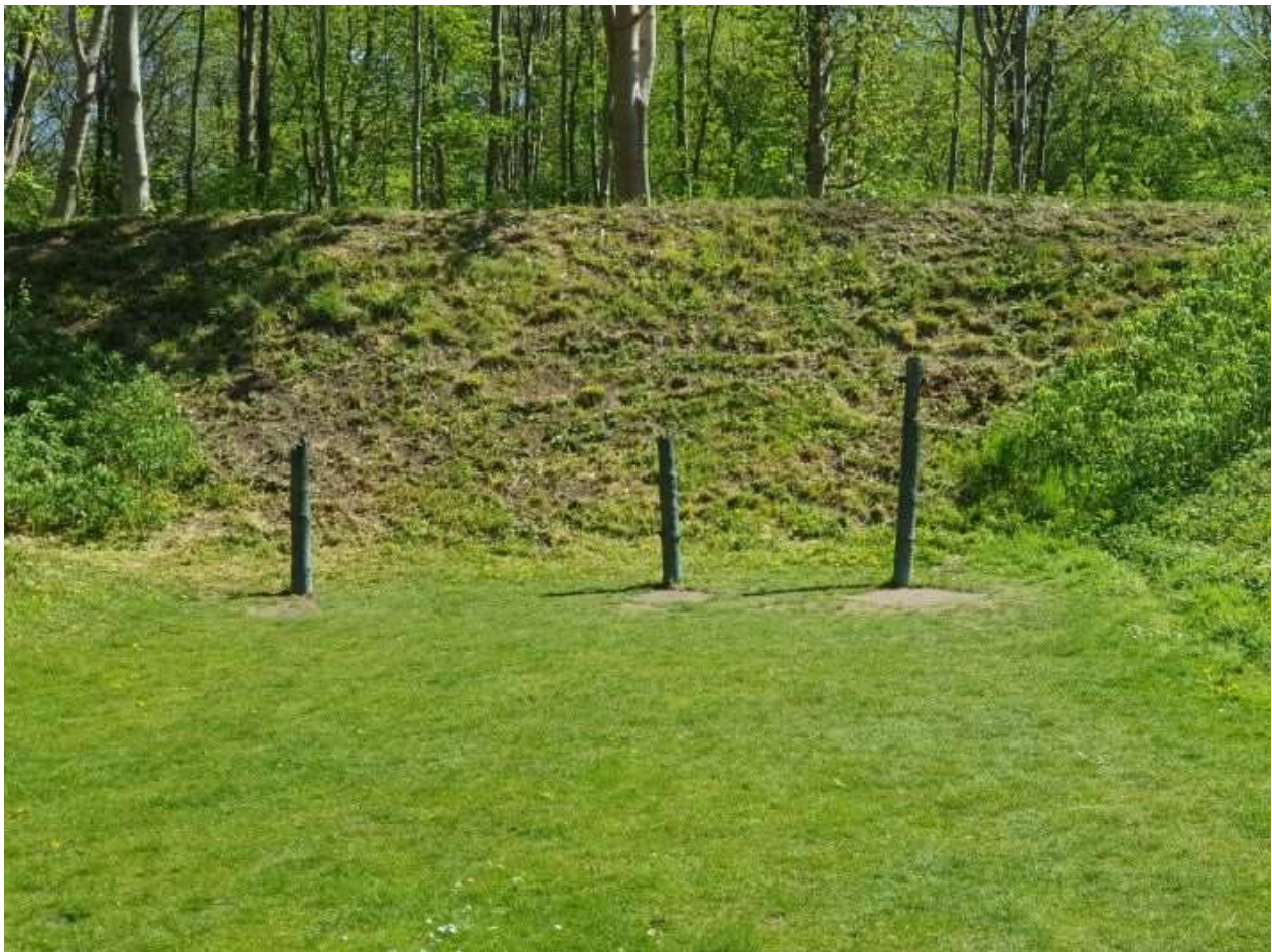
Henrettelsespælene i Ryvangen – maj 2020