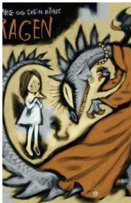
(/boeger/dragen-1) DRAGEN (/BOEGER/DRAGEN-1) Af Gro Dahle