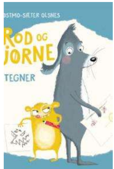
(/boeger/rod-og-bjorne-tegner) ROD OG BJØRNE TEGNER (/BOEGER/ROD-OG-BJØRNE-TEGNER) Af Hege Østmo-Sæter Olsnes