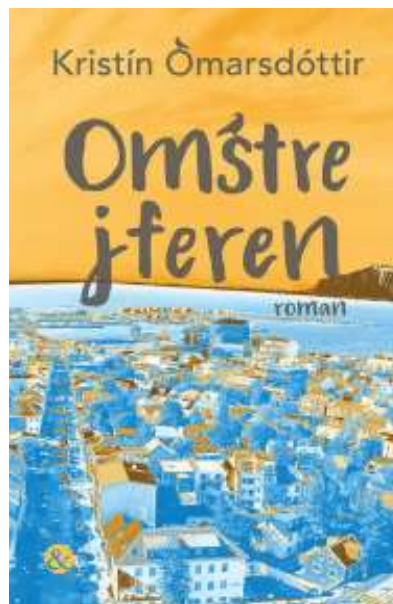
(/boeger/omstrejferen) OMSTREJFEREN (/BOEGER/OMSTREJFEREN) Af Kristín Ómarsdóttir