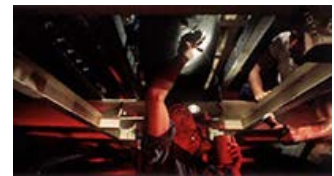
Fig. 2: Ship Ahoy! Freddie Quell fejrer den amerikanske sejr i Anden Verdenskrig med en ordentlig tår af en torpedo. Scenen er ifølge Anderson selv inspireret af en anekdote, som den aldrende karakterskuespiller Jason Robards fortalte ham under indspilningerne af Magnolia - filmen der blev et stærkt spillet punktum for Robards karriere.