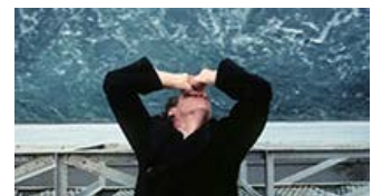
Fig. 3: Havet er et konstant motiv gennem hele The Master og sjældent har det været filmet så blændende.