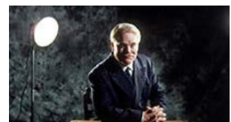
Fig. 4: Lancaster Dodd (Phillip Seymour Hoffman) i sin bedste Orson Welles-positur.