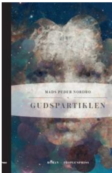
(/boeger/gudspartiklen) GUDSPARTIKLEN (/BOEGER/GUDSPARTIKLEN) Af Mads Peder Nordbo