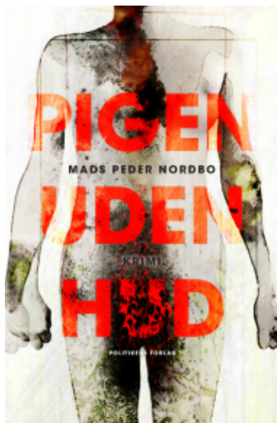
(/boeger/pigen-uden-hud) PIGEN UDEN HUD (/BOEGER/PIGEN-UDEN-HUD) Af Mads Peder Nordbo