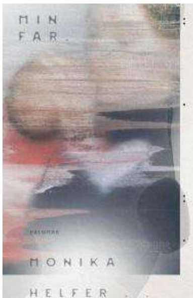
(/boeger/far-0) FAR (/BOEGER/FAR-0) Af Monika Helfer