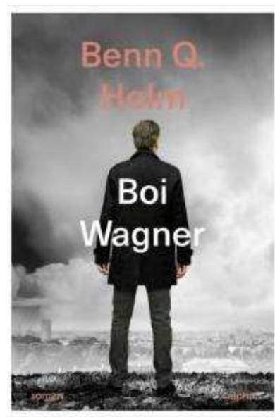
(/boeger/boi-wagner-roman) BOI WAGNER (/BOEGER/BOI-WAGNER-ROMAN) Af Benn Q. Holm (f. 1962)