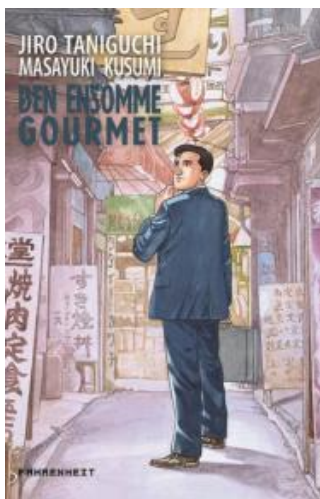
(/boeger/den-ensomme-gourmet) DEN ENSOMME GOURMET (/BOEGER/DEN-ENSOMME-GOURMET) Af Jiro Taniguchi