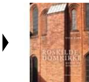
▶ ROSKILDE DOMKIRKE. KUNST OG HISTORIE

( http://www.historie-online.dk/boger/anmeldelser-5-5/kirke-og-religion/roskilde-domkirke-kunst-og-historie ) ( http://www.historie-online.dk/boger/memento-mori )