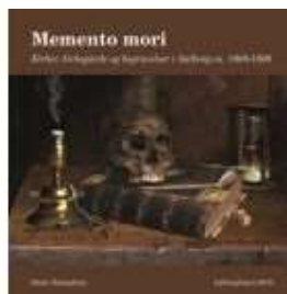
▶ MEMENTO MORI

( http://www.historie-online.dk/boger/anmeldelser-5-5/kirke-og-religion/roskilde-domkirke-kunst-og-historie ) ( http://www.historie-online.dk/boger/memento-mori )