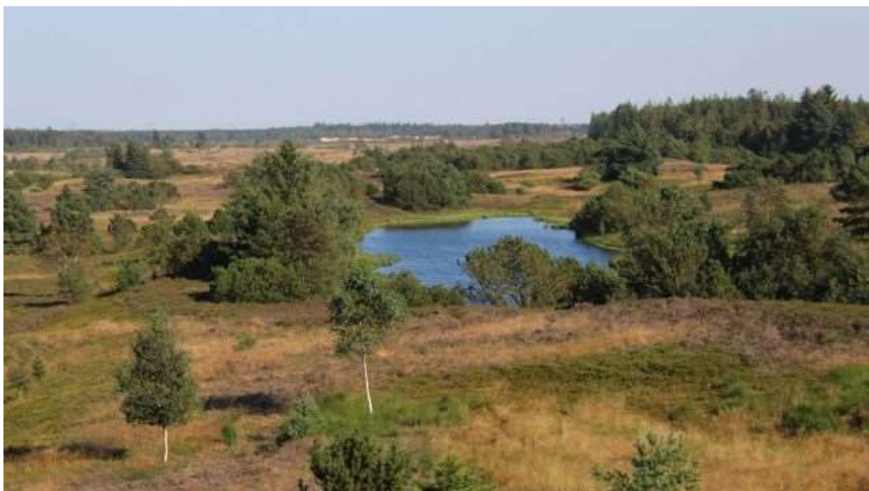
Grene Sande ved Billund fremstår i dag som et hedelandskab med plantager