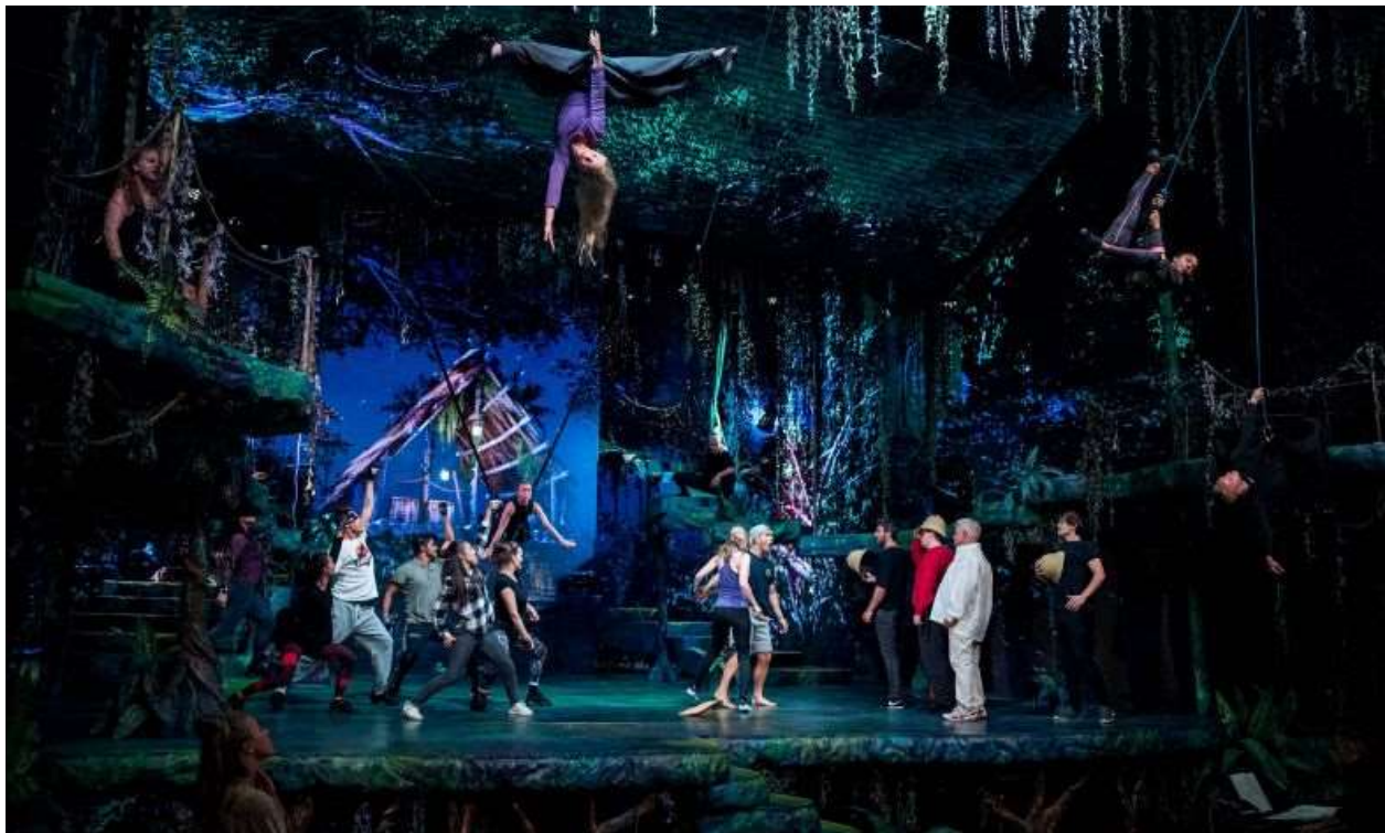
Opsætningen af musicalen Tarzan blev en af de store succeser fra Fredericia

Den centrale placering ved motorvejsnettet har yderligere medført, at mange af områdets indbyggere er pendlere, der således har let ved at komme på arbejde i andre større byer. Man målte i 2019 den daglige trafik over Lillebæltsbroen. Den var på godt 80.000 køretøjer. Det er dobbelt så mange som over Storebæltsbroen, hvilket understreger områdets store antal pendlere.