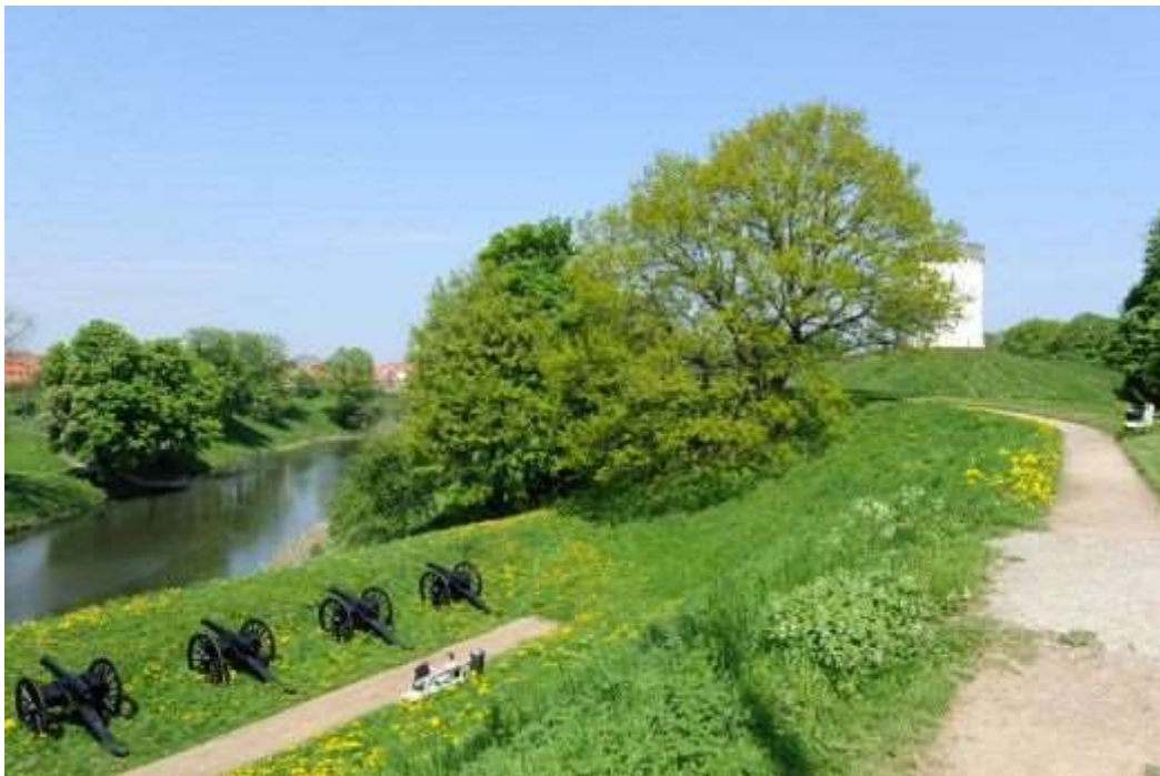
I disse år skifter voldanlægget markant udseende. Man har besluttet at fælde de mange træer, der gennem årene er vokset op og har skjult de oprindelige anlæg.

Ingen, der kommer til Fredericia, kan undgå at bemærke, at det er en fæstningsby. Den eneste af slagsen i Danmark. Omgivet af imponerende volde med kanonbestykninger og voldgrave signalerer den, at her kunne man ikke uden videre komme ind. Og for eventuelle angribere var det en ganske uoverskuelig opgave at trænge ind.