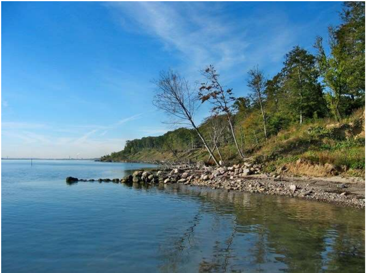
Kystbillede fra Trelde Næs.

Trap Danmarks bind 15 har absolut samme høje standard som de øvrige i serien. Fine og grundige tekster, fornemme billeder og dybdeborende artikler. Det er et værk, det må være svært at undvære for lokalinteresserede læsere.