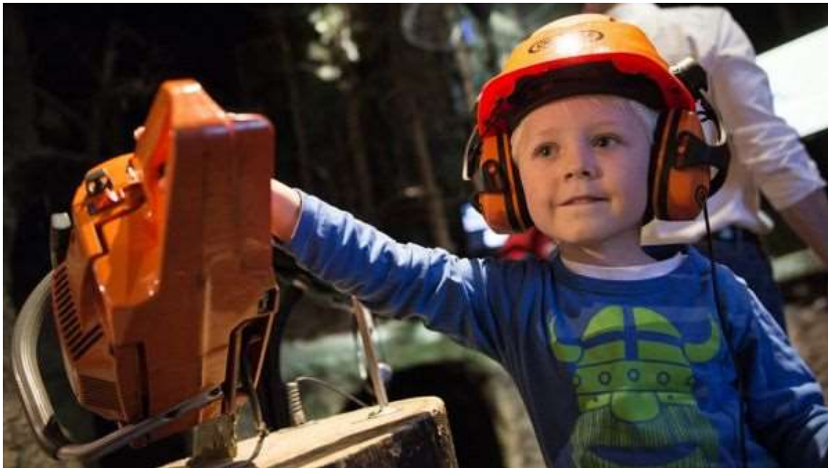
Økolariet åbner helt nye verdener for publikum i alle aldre. Her siger billedet vist alt.

"I 2013 blev Vejle som den eneste kommuner i landet en del af organisationen Rockefeller Foundation netværk for bæredygtige byer. Derfor er kommunen i fuld gang med at tage fat på de mange udfordringer. Herunder klimatilpasningerne.