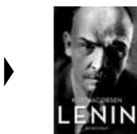
LENIN - EN BIOGRAFI

(/article/items/view/2898/4) ( http://www.historie-online.dk/boger/anmeldelser-5-5/rusland-sovjet/lenin-en-biografi )