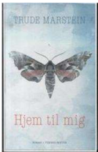
(/boeger/hjem-til-mig) HJEM TIL MIG (/BOEGER/HJEM-TIL-MIG) Af Trude Marstein