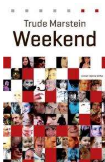
(/boeger/weekend-1) WEEKEND (/BOEGER/WEEKEND-1) Af Trude Marstein