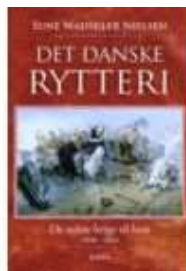
DET DANSKE RYTTERI

( https://www.historie-online.dk/boger/den-danske-droem-om-revanche )