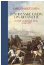
DEN DANSKE DRØM OM REVANCHE

( https://www.historie-online.dk/boger/den-danske-droem-om-revanche )