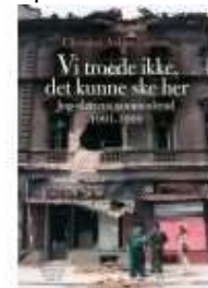
VI TROEDE IKKE, DET KUNNE SKE HER

( https://www.historie-online.dk/boger/anmeldelser-5-5/1800-arene-37/det-danske-rytteri )