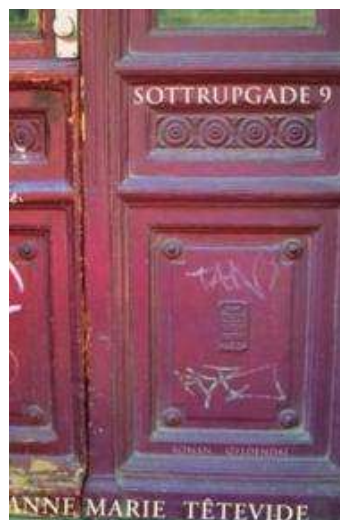
(/boeger/sottrupgade-9) SOTTRUPGADE 9 (/BOEGER/SOTTRUPGADE-9) Af Anne Marie Têtevide