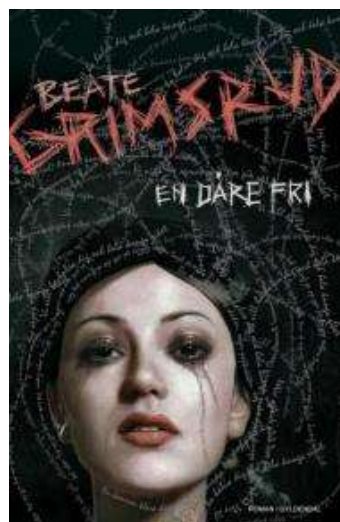
(/boeger/en-dare-fri) EN DÆRE FRI (/BOEGER/EN-DARE-FRI) Af Beate Grimsrud