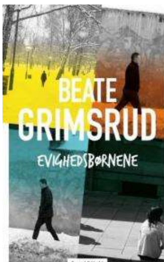
(/boeger/evighedsbornene) EVIGHEDSBØRNENE (/BOEGER/EVIGHEDSBØRNENE) Af Beate Grimsrud