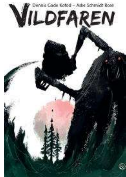
(/boeger/vildfaren-af-dennis-gade-kofod) VILDFAREN AF DENNIS GADE KOFOD (/BOEGER/VILDFAREN-AF-DENNIS-GADE-KOFOD) Af Dennis Kade Kofod