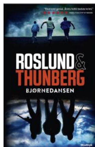
(/boeger/bjornedansen) BJØRNEDANSEN (/BOEGER/BJØRNEDANSEN) Af Anders Roslund