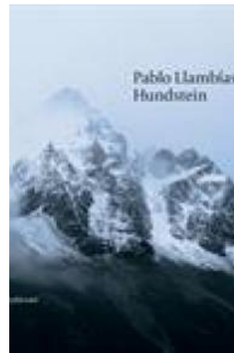
(/boeger/hundstein) HUNDSTEIN (/BOEGER/HUNDSTEIN) Af Pablo Llambías