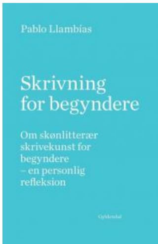
(/boeger/skrivning-begyndere) SKRIVNING FOR BEGYNDERE (/BOEGER/SKRIVNING-BEGYNDERE) Af Pablo Llambías