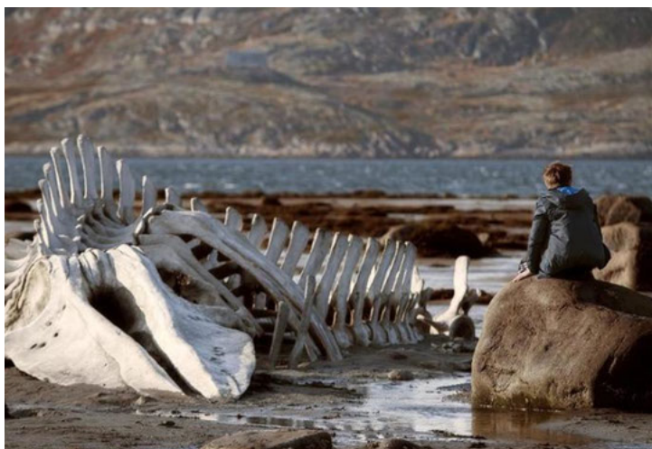
Foto: Still fra Leviathan trailer.

FILMANMELDELSE | Den Russiske instruktør Andrej Svjagintsev har skabt et filmisk mesterværk. Leviathan har allerede fået massiv opmærksomhed ved både Cannes og London filmfestival og regnes som favorit til titlen som årets udenlandske film ved den kommende Oscaruddeling. Det er historien om korruption, kærlighed og menneskelig magtesløshed - En klassisk tragedie, som den kun kan udspille sig i en russisk fortælling.