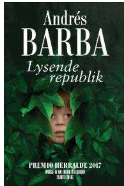
(/boeger/lysende-republik) LYSENDE REPUBLIK (/BOEGER/LYSENDE-REPUBLIK) Af Andrés Barba (f. 1975)