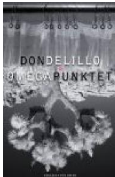
(/boeger/omegapunktet) OMEGAPUNKTET (/BOEGER/OMEGAPUNKTET) Af Don DeLillo