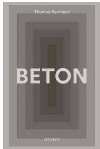
(/boeger/beton-0) BETON (/BOEGER/BETON-0) Af Thomas Bernhard