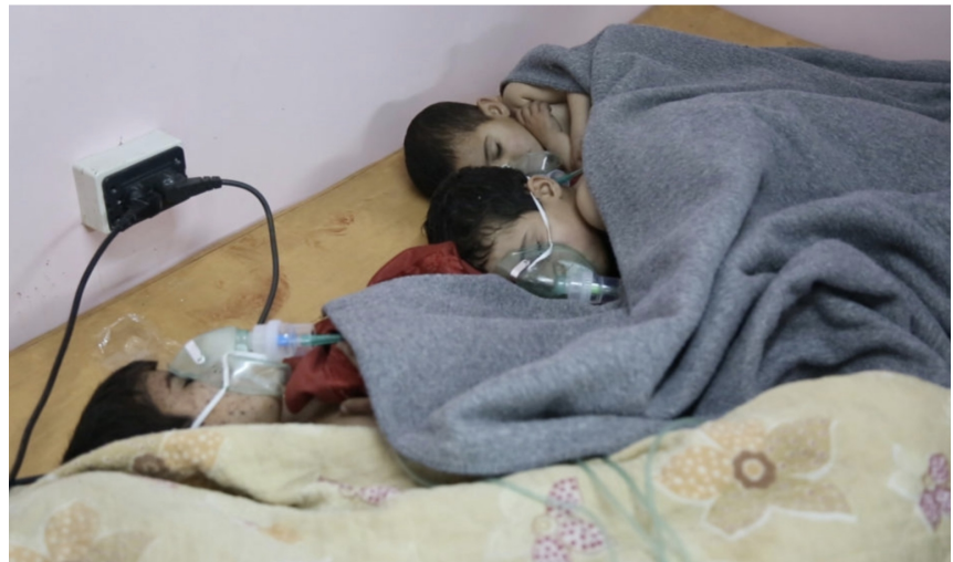
BØRN DER FÅR ILT EFTER ET ANGREB MED GIFTGAS – NATIONAL GEOGRAPHIC.

Her kæmper hun sammen med sine kolleger med alt for mange ofre døgnet rundt. Både voksne og børn bliver båret ind med granatsplinter i halsen, øjnene, maven, benene og kroppen. I den første halvdel af filmen med "normale" skader og i anden del med de barbariske og dødelige eftervirkninger af giftgas.