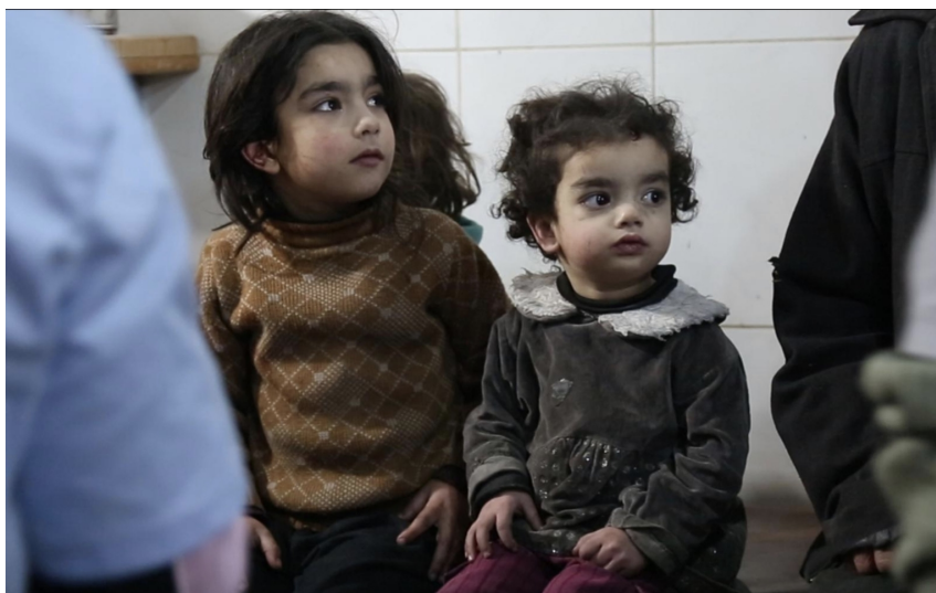
BØRNEBESØGERS BLIKKE VAR NOGET AF DET SVÆRESTE AT VÆRE VIDNE TIL I FILMEN.

Tværtimod minder det os om, at kvinder i denne del af verden, ikke har udsigt til lige muligheder på noget tidspunkt; heller ikke efter Assad har forladt scenen.