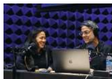
Stephen Dubner og Angela Duckworth

PODCAST 'NO STUPID QUESTIONS' STEPHEN DUBNER & ANGELA DUCKWORTH FREAKONOMICS