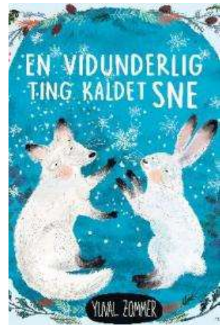
(/boeger/en-vidunderlig-ting-kaldet-sne) EN VIDUNDERLIG TING KALDET SNE (/BOEGER/EN-VIDUNDERLIG-TING-KALDET-SNE) Af Yuval Zommer