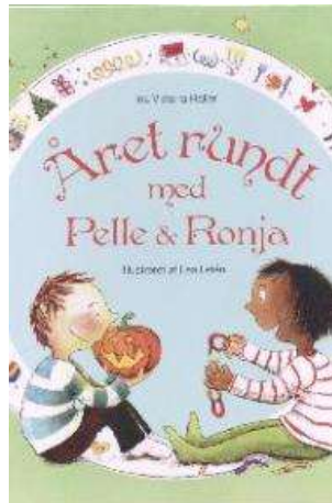
(/boeger/aaret-rundt-med-pelle-ronja) ÅRET RUNDT MED PELLE & RONJA (/BOEGER/AARET-RUNDT-MED-PELLE-RONJA) Af Ina Victoria Haller