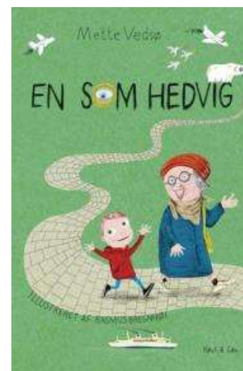
(/boeger/en-som-hedvig) EN SOM HEDVIG (/BOEGER/EN-SOM-HEDVIG) Af Mette Vedse