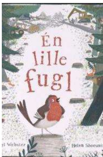
(/boeger/en-lille-fugl-0) ÉN LILLE FUGL (/BOEGER/EN-LILLE-FUGL-0) Af Sheryl Webster