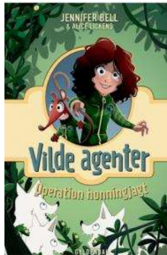
(/boeger/vilde-agenter-operation-honningjagt) VILDE AGENTER - OPERATION HONNINGJAGT (/BOEGER/VILDE-AGENTER-OPERATION-HONNINGJAGT) Af Jennifer Bell