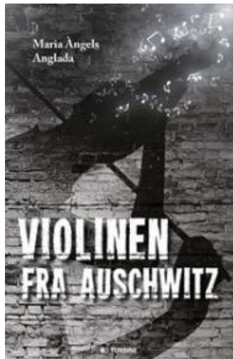
(/boeger/violinen-fra-auschwitz) VIOLINEN FRA AUSCHWITZ (/BOEGER/VIOLINEN-FRA-AUSCHWITZ) Af Maria Angels Anglada