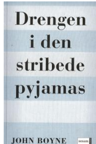
(/boeger/drengen-i-den-sribede-pyjamas) DRENGEN I DEN STRIBEDE PYJAMAS (/BOEGER/DRENGEN-I-DEN-STRIBEDE-PYJAMAS) Af John Boyne