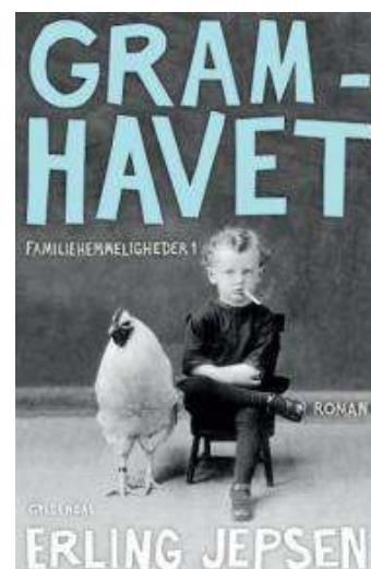
(/boeger/gramhavet) GRAMHAVET (/BOEGER/GRAMHAVET) Af Erling Jepsen