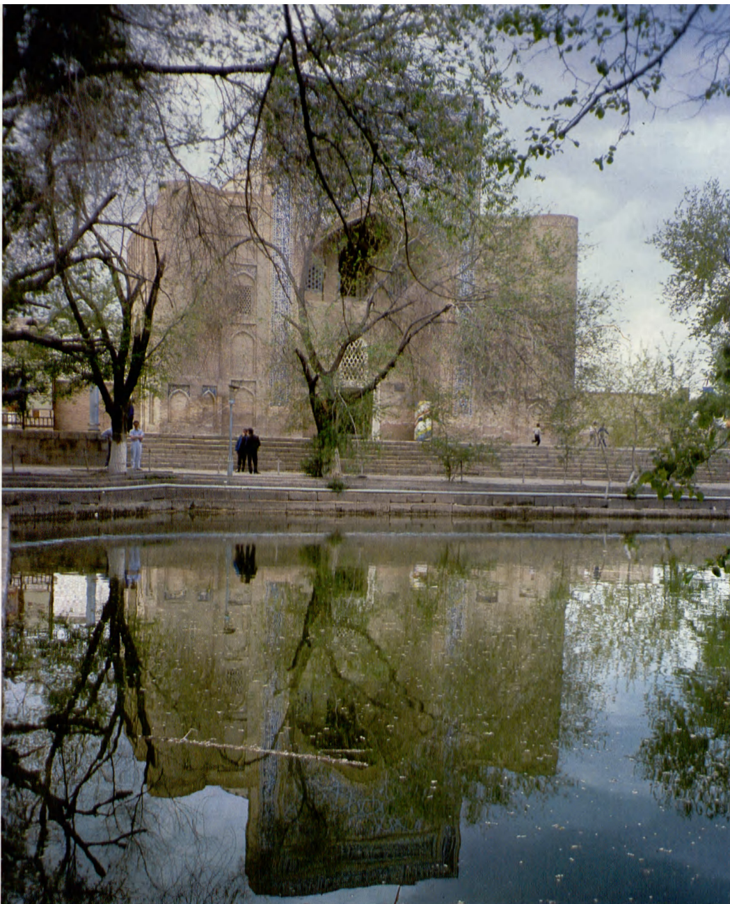
Divan-Beghi madrasaen i Bokhara, Usbeghistan fra 1622 ligger ud til et stort vandreservoir, der står i forbindelse med byens kanalsystem, anlagt af herskeren Timur.

• Divan-Beghi madrasa in Bukhara from 1622 lies on a large reservoir, which is connected to the city's canal system, established by Timur