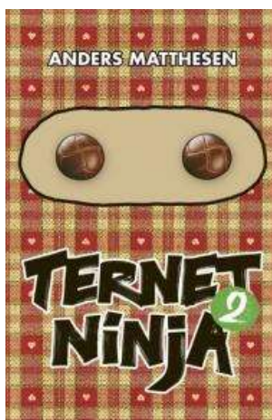
(/boeger/ternet-ninja-bind-2) TERNET NINJA 2 (/BOEGER/TERNET-NINJA-BIND-2) Af Anders Matthesen