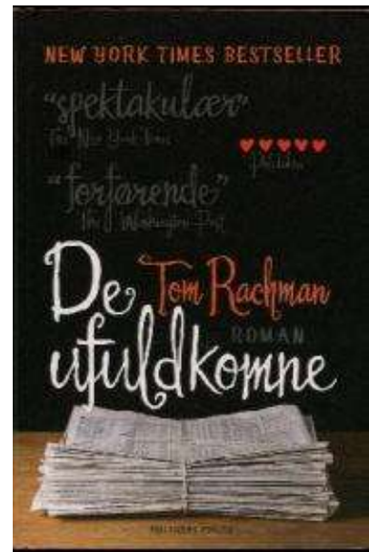
(/index.php/boeger/de-ufuldkomne) DE UFULDKOMNE (/INDEX.PHP/BOEGER/DE-UFULDKOMNE) Af Tom Rachman